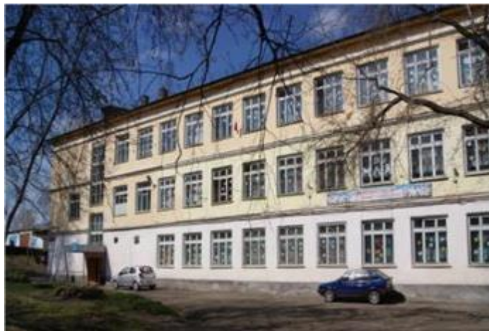
Современный вид школы №22. 2012 год

В честь Вячеслава в мае 2012г. на стене фасада школы №22 установлена мемориальная доска.